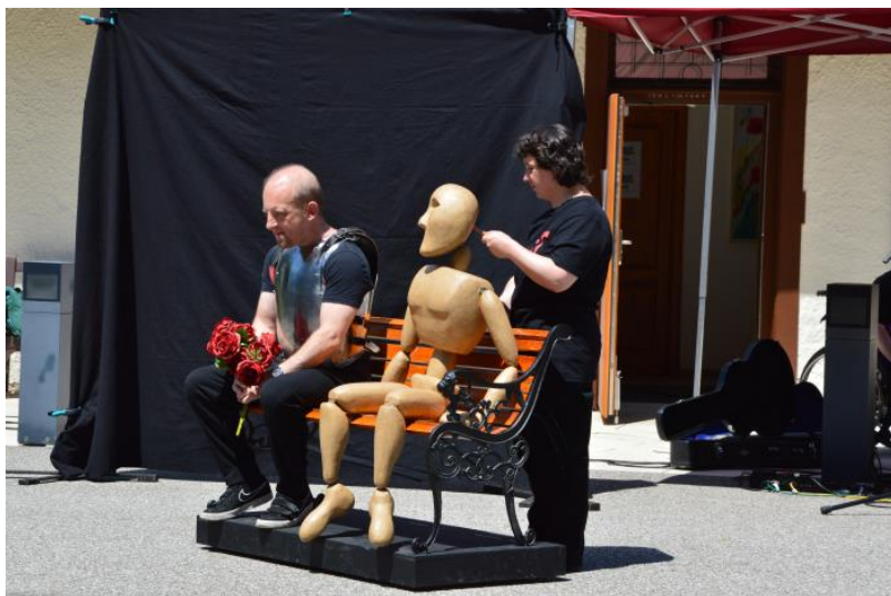
Ausschnitt aus der Aufführung des Theaters "die Tonne" aus Reutlingen

(Das Bündnis „Wir sind dran“ ist ein Zusammenschluss von mehreren LEADER-Aktionsgruppen - Mittlere Alb, Oberschwaben, Mittleres Oberschwaben und Württembergisches Allgäu -, dem Evangelischen Bildungswerk, dem Kirchlichen Dienst in der Arbeitswelt, dem Verband Katholisches Landvolk und dem K-Punkt Ländliche Entwicklung).